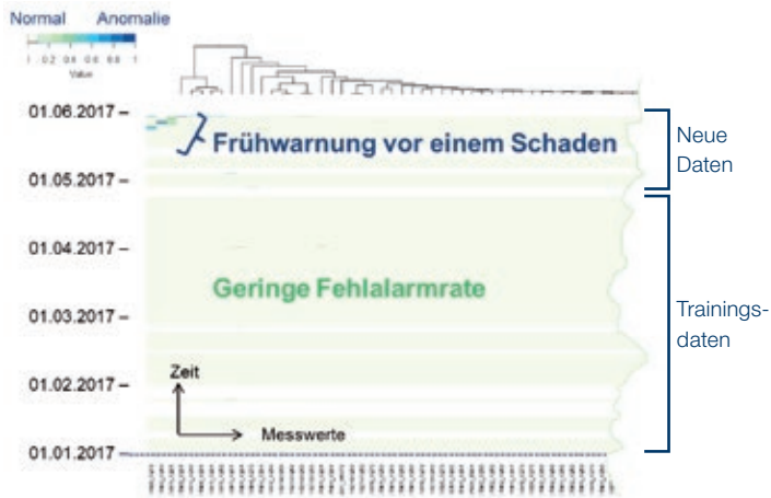
Jahresübersicht aller Messwerte, erste Anomalien ab 05/17